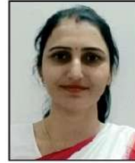
PUSHPA 202081-070014 MASA-F