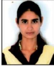
MAMTA 202080-070765 MAGE-F