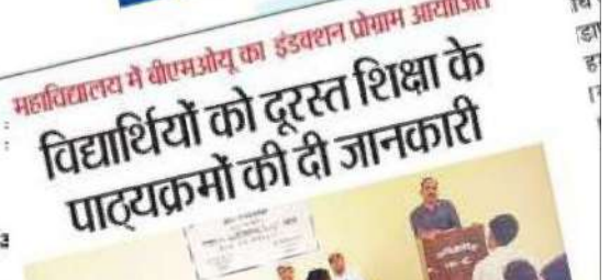
वर्धमान महावीर खुला विश्वविद्यालय