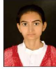
KAVITA 214081-010001 MASA-F